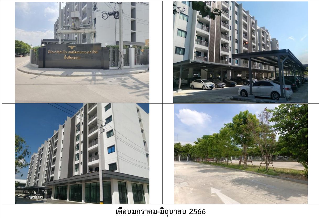
รูปที่ 1.3-1 สภาพปัจจุบันของโครงการ

การดำเนินงานปัจจุบัน (เดือนมกราคม-มิถุนายน พ.ศ. 2566) โครงการก่อสร้างอาคารพักอาศัย พร้อมสิ่งอำนวยความสะดวกของ สำนักงานปลัดกระทรวงกลาโหม (พื้นที่บางจาก (พื้นที่ 1)) เป็นการดำเนินงานในระยะดำเนินการ เนื่องจากการก่อสร้างโครงการได้เสร็จสิ้นแล้วเมื่อเดือนมกราคม - มิถุนายน พ.ศ. 2566 แสดงดังรูปที่ 1.3-1